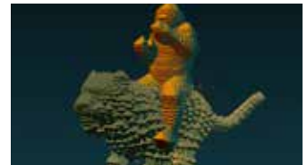
Miao Xiaochun , The Feast