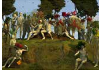
Miao Xiaochun Restart digital animasjon, 14 min 22 sek

Huang Jueping is an area where urban life confronts rural life. We are performers as well as observers of a play filled with ruin and rebirth, belief and insanity, nightmare and reality. This is an era when personal experience and collective experience clash. How does this affect us, and what does it do to our souls?