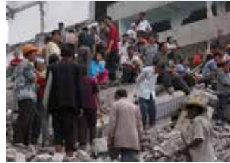
Zhao Zhao Project Taklamakan kunstdokumentar, 20 min 16 sek

LØRDAG 25. FEBRUAR KL 19.00 PROGRAMMET OPPSUMMERT