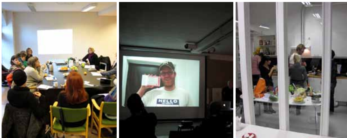
Bilder fra aktivitetene