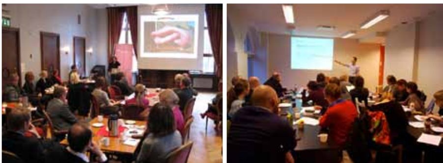
Bilder fra aktivitetene

Visp og Brak arrangerte i samarbeid et styrekurs med fokus på styremedlemmers juridiske ansvar. Kurset ble beregnet på Brak og Visps egne styremedlemmer, men vi inviterte også medlemmer som hadde styreverv innen andre organisasjoner og foretak.